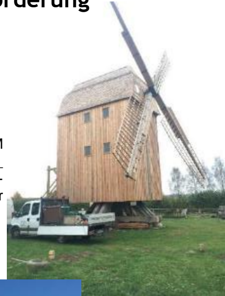
Stadt RDG- FLM Klockenhagen_ Bockwindmühle, FP 2042- kleine tourist. Infrastruktur