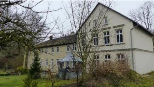
Bialek, Gutshaus Pantlitz- FP 2038 -private Dorferneuerung