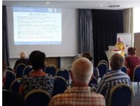
LAG Rügen - Strategieerstellung