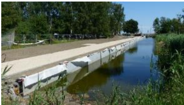
Zuwegung Promenade Dierhagen