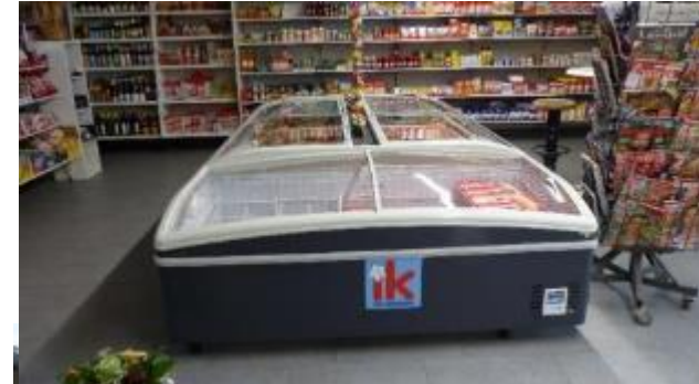
Neue Dorfmitte Glewitz- Ausstattung- FP 2040- Basisdienstleistungen Grundversorgung (Dorfläden)