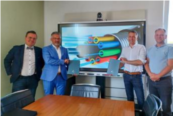
Vertragsunterzeichnung SWS Telnet und LK am 12.06.2023