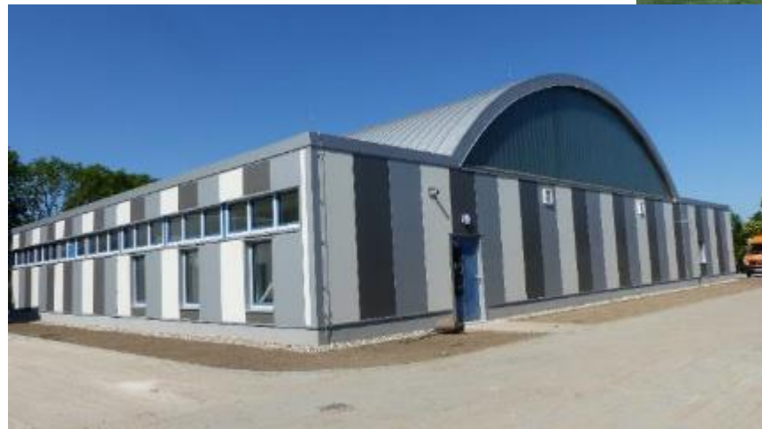
Umbau Turnhalle zum Gemeinschaftshaus Saal