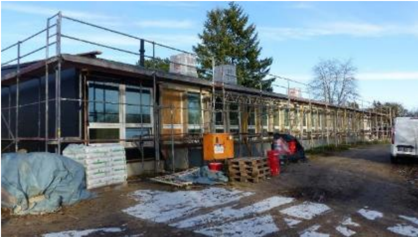
Schule Steinhagen (2022-2024)- FP 2041- Basisdienstleistungen Grundversorgung (Schulen)