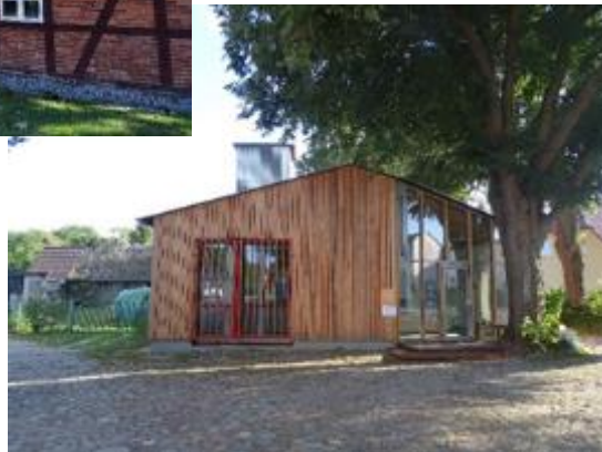
Dorfgemeinschafts- haus Kasnevit