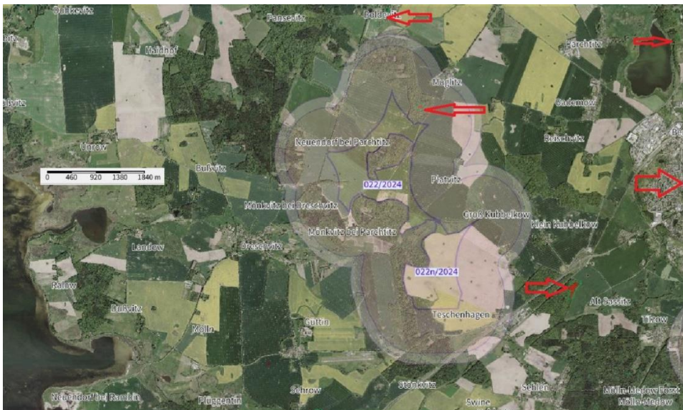
Kartenausschnitt VRG 022/2024 und 022n/2024

Bei den im Umweltbericht aufgeführten Bodendenkmälern handelt es sich überwiegend um Wüstungen des Mittelalters und der Neuzeit. Dies sind umfangreiche Bodendenkmäler, deren Dokumentation erhebliche Kosten verursachen würde.