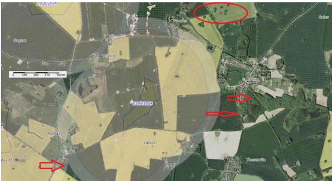
Kartenausschnitt VRG 019n/2024, Gemeinde Stadt Bergen auf Rügen, Patzig

Der Umweltbericht berücksichtigt nicht, dass sich in ca. 1.200 m Entfernung, Richtung Nordosten die Woorker Berge befinden. Diese Konzentration sehr imposanter Grabhügel bildet ein Ensemble, das bei den Bewohnern Rügens weit bekannt ist. Hier ist die Beeinträchtigung schwer abzuschätzen, dies hängt wesentlich von der Höhe der geplanten Anlagen ab, zumal die Hügelgräber selbst deutlich ins Umland wirken. Im Genehmigungsverfahren sind die Auswirkungen zu prüfen.