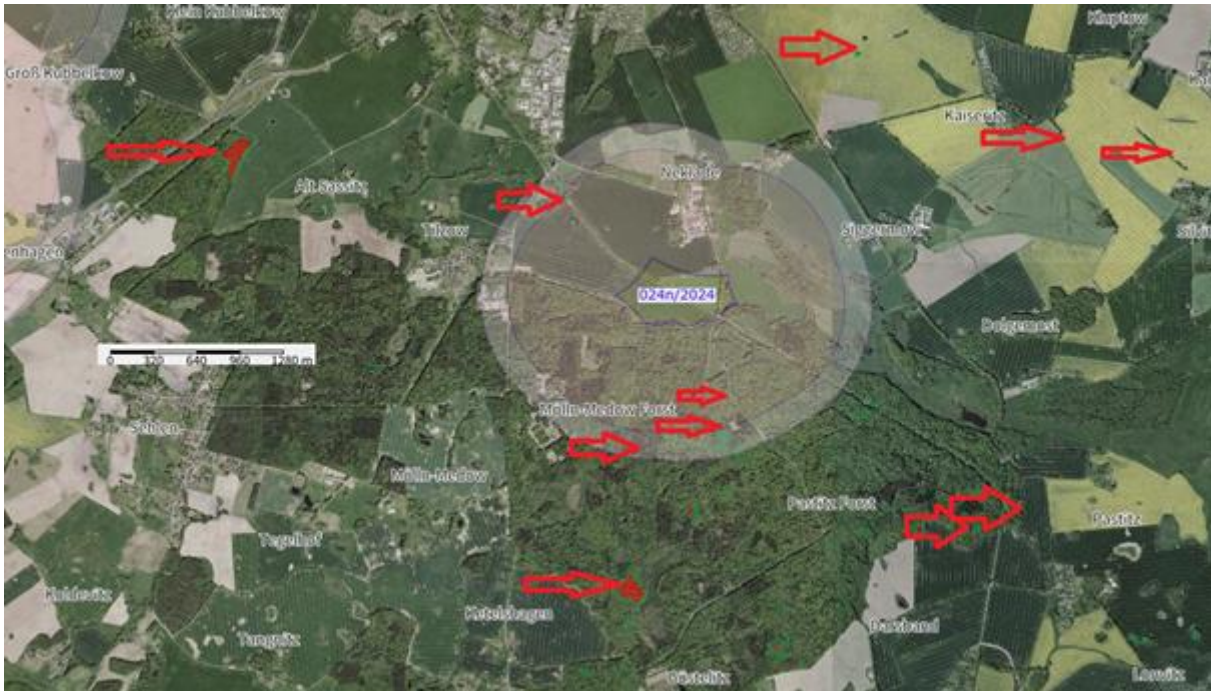
Kartenausschnitt VRG 024n/2024

Bei dem im Umweltbericht genannten Fundplatz am östlichen Rand handelt es sich um ein slawisches Körpergräberfeld. Hierbei handelt es sich um ein veränderbares Bodendenkmal.