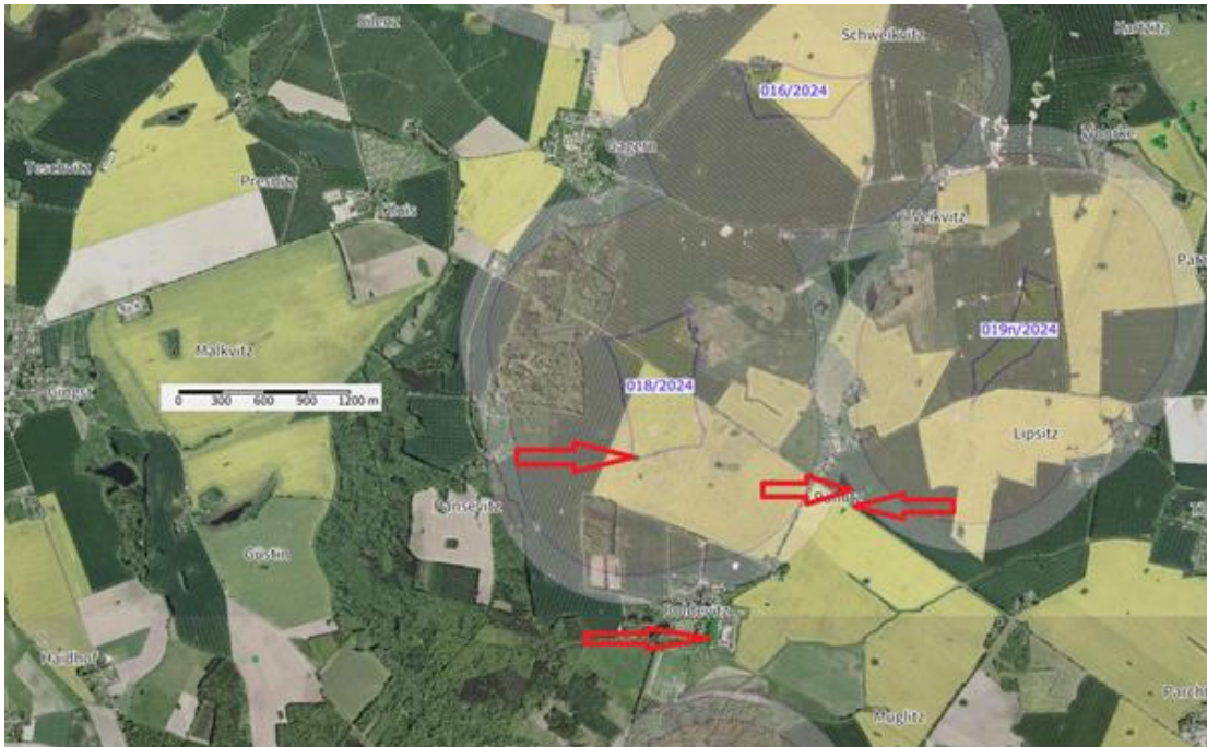
Kartenausschnitt VRG 018/2024, Gemeinde Stadt Bergen auf Rügen, Parchtitz, Kluis