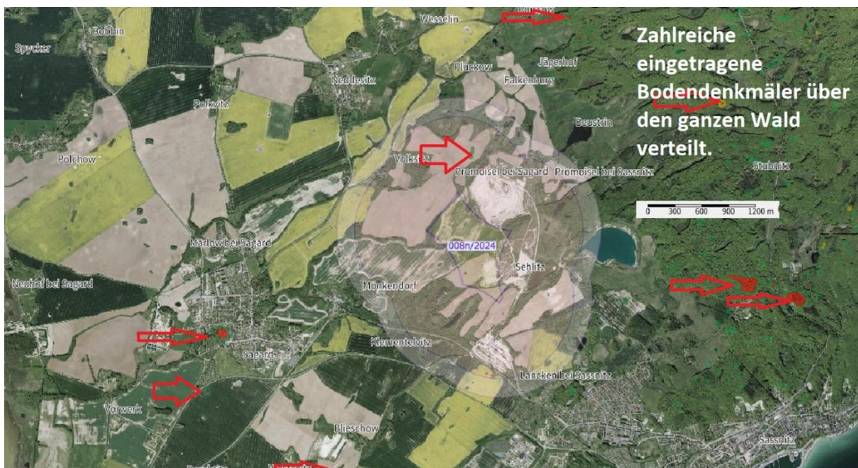
Kartenausschnitt VRG 008n/2024, Gemeinde Sagard

Das Vorranggebiet hat laut Umweltbericht Auswirkungen auf eingetragene Bodendenkmäler im Umkreis von 400-1.000 m. Innerhalb der Fläche liegt das überpflügte, aber im digitalen Geländemodell gut abgrenzbare Hügelgrab Mönkendorf, Fpl. 11.