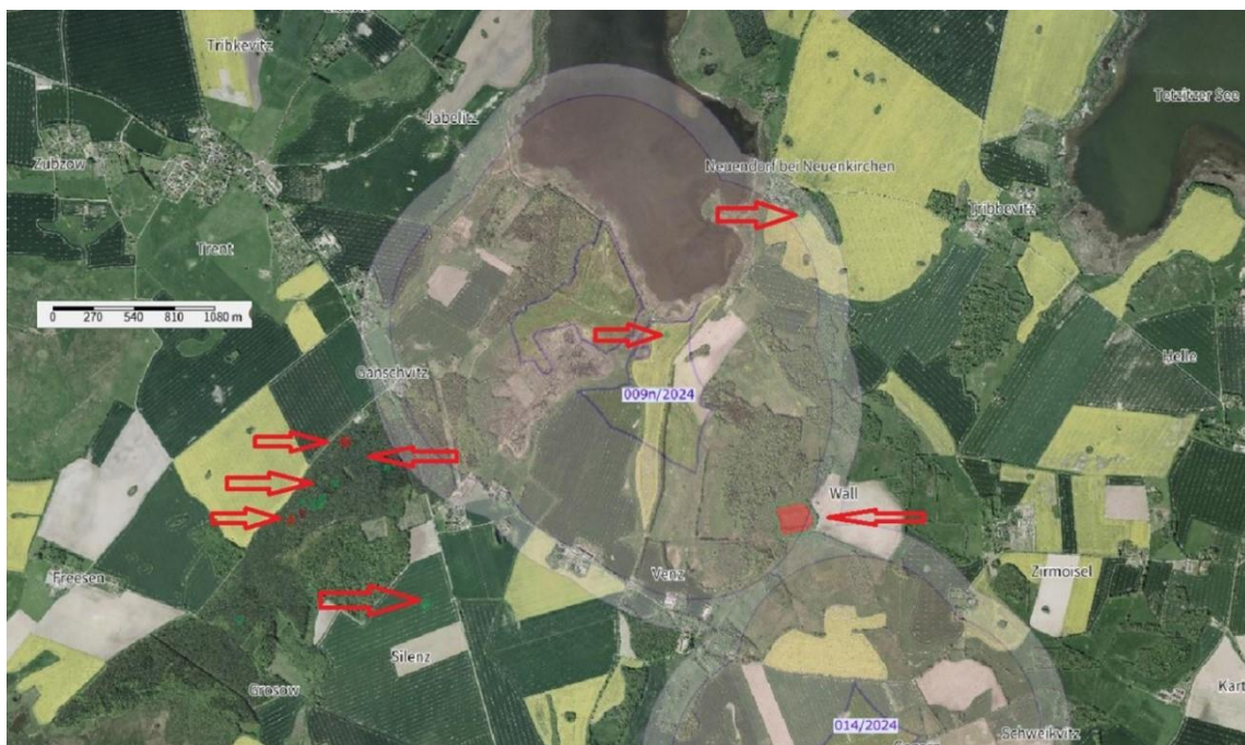
Kartenausschnitt VRG 009n/2024, Gemeinde Trent

Im Umfeld des Vorranggebietes befinden sich weitere Bodendenkmäler, die betroffen sein werden, v. a. der in einer Entfernung von etwas über 500 m liegende und für die die Geschichte Rügens bedeutsame Burgwall von Venz (Gemarkung Wall) (siehe 014/2024).