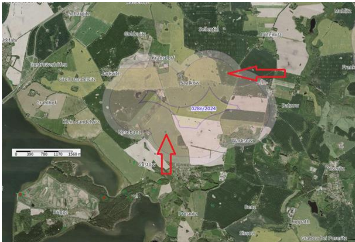
Kartenausschnitt VRG 028n/2024